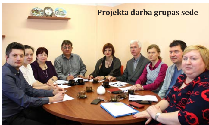
Projekta darba grupas sēdē

Latvijas Nedzirdīgo savienība no šī gada marta līdz jūnijam realizē projektu „Aktīvi nākotnei”. Projekta mērķis ir sekmēt iekļaujoša darba tirgus attīstību, diskutējot par pieredzi, esošo situāciju un iespējamiem risinājumiem nedzirdīgo personu nodarbinātībā Eiropas Savienībā.