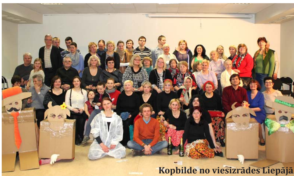
Kopbilde no viesizrādes Liepājā

Veiksmīgs bija mūsu starts Starptautiskajā amatieru teātru festivālā „Rīga spēlē teātri 2014”, kurā LNS deju un drāmas amatierkolektīvu no kultūras nama „Rītausma” izrāde „Dzīves skola Nr.1” saņēma diplomu par „Asprātīgu vizuālo jaunradi” un „Rītausmas” radošās grupas izrāde „Balerīnas” saņēma diplomu par „Par veiksmīgu ārzemju dramaturģijas iestudējumu”.