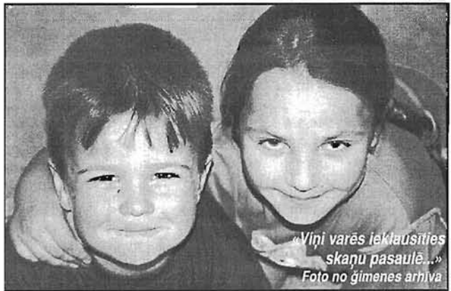
«Viņi varēs ieklausīties skaņu pasaulē...»

Bērniem liels palīgs ir digitālie dzirdes aparāti, kuri labi palīdz uztvert skaņas. Sākumā viņi lietoja parastos dzirdes aparātus, bet tie bērniem rada galvas un ausu sāpes. Puika parasti met to aparātu nost, jo viņam tas traucē. Dzirdes centrā vecāki uz-