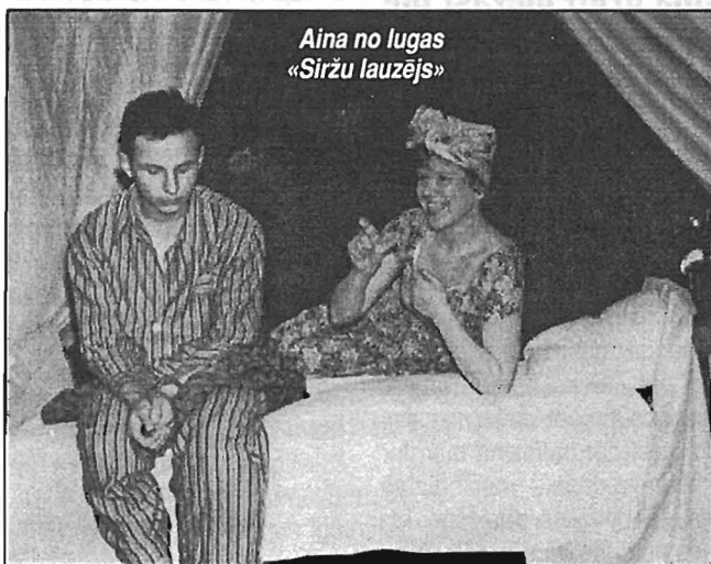
Aina no lugas «Siržu laužējs»