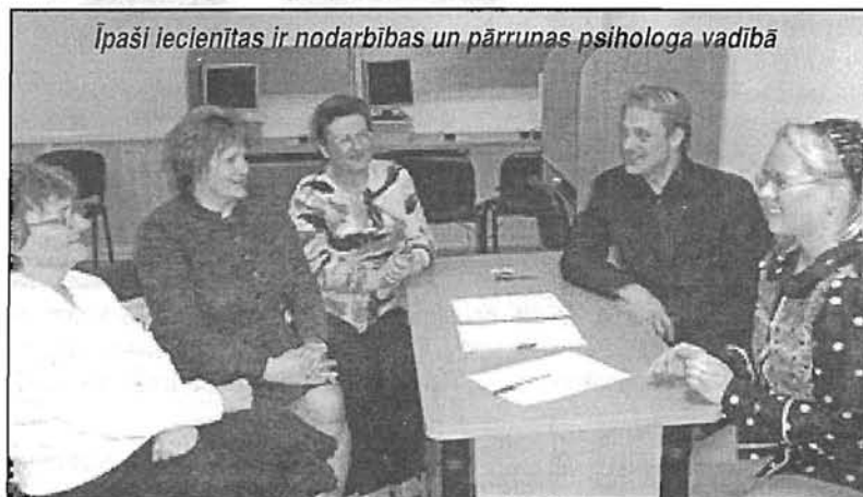
Īpaši iecienītas ir nodarbības un pārrunas psihologa vadībā

Aptaujātie lekciju klausītāji uzskata, ka jautājumi konsultantiem radīsies tad, kad sā-