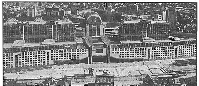
Eiropas Savienības Parlaments. Par Latvijas deputātiem ES parlamentā balsosim 12. jūnijā.

Perspektīvas. Pārmaiņas gaida visus. Grūts būs pārejas, pielāgošanās periods visu valstu dzīvē. Nāksies iepazīt jaunus tuvākos kaimiņus, rēķināties citam ar citu, palīdzēt, atbalstīt citam citu, praksē iemācīties strādāt, attīstīties un sadzīvot uz vienota stipra pamata. Ja to visas 25 valstis saprātīs un paveiks, dzīve ES lielajā mājā kļūs arvien ērtāka un labklājīgāka. Tam ir liels piemērs — attīstītā pēckara Eiropa, kuras sastāvā esošo valstu darbību jau 50 gadu sekmīgi regulē un virza Eiropas Savienības likumdošana. ♦