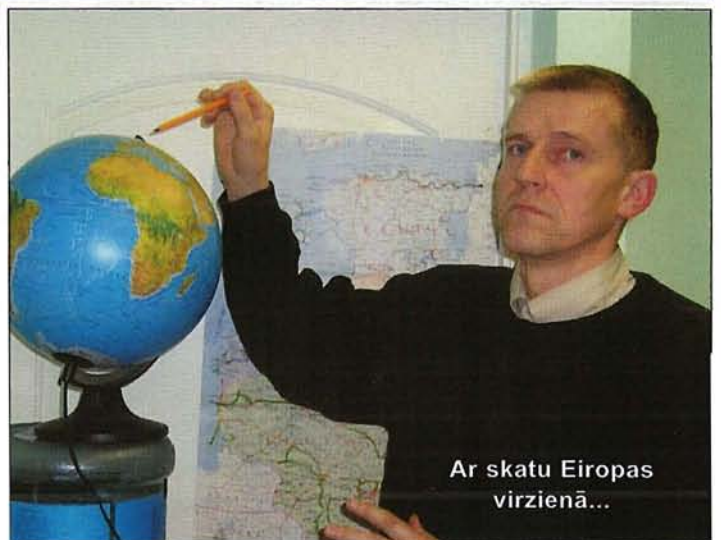
Ar skatu Eiropas virzienā...

Jāpasmaida, bet par mūsu spējīgākajiem, projektos pieredzējušākajiem cilvēkiem notiek gandrīz vai cīņa, jo šādu cilvēku mūsu - nedzirdīgo vidū, nemaz nav tik daudz. Es pats vēl mek-