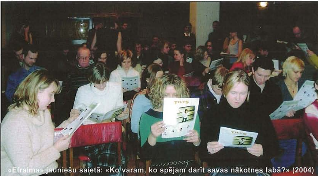
«Efralma» jauniešu saietā: «Ko varam, ko spējam darīt savas nākotnes labā?» (2004)

Nebija viegli arī nokomplektēt darba grupu ar zinošiem un uzņēmīgiem cilvēkiem, jo visi gudrākie jaunie nedzirdīgie cilvēki aizņemti savos tiešajos darbos. Tāpēc liels paldies mūsu komandai par gatavību strādāt un izpildīt projektā izvirzītos uzdevumus.»