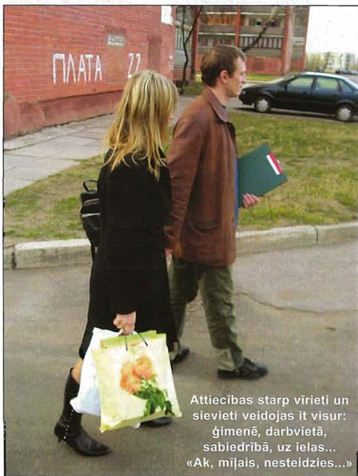
Attiecības starp vīrieti un sievieti veidojas it visur: ģimenē, darbvietā, sabiedrībā, uz ielas... «Ak, mīļais, nesteidzies...»

Sniegt ieskatu dzimumu līdztiesības jēdziena izpratnē un informēt par LNS valdes šai tēmai veltītā projekta «Klusās rokas» realizācijas gaitu — tāds ir šī un nākamo citu «KS» speciāllaiidņu mērķis.