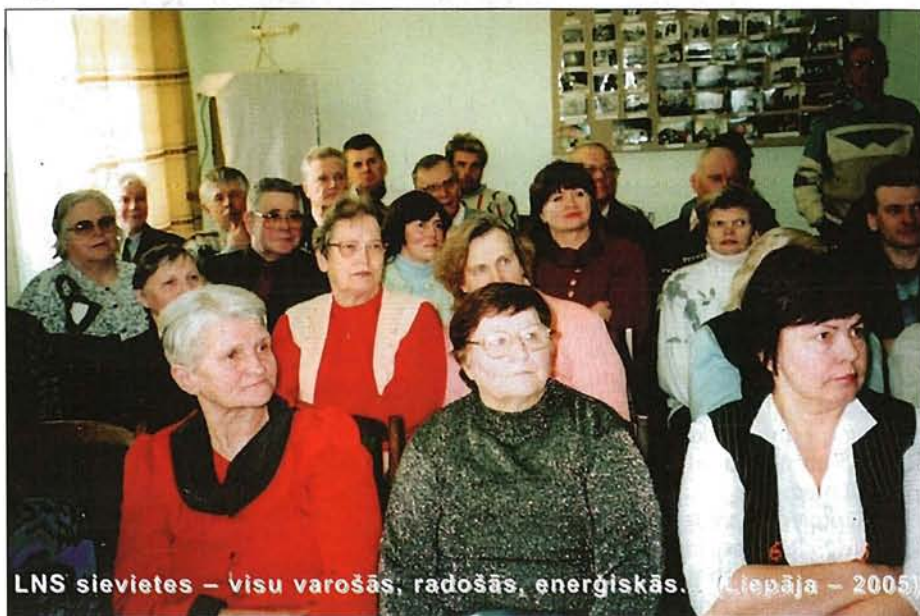
LNS sievietes – visu varošās, radošās, enerģiskās. (Liepāja – 2005)

— Projekts risinās EQUAL izvirzīto virsuzdevumu «Vienādas iespējas vīriešiem un sievietēm». Tas saucas «Klusās rokas», un pašlaik jau notiek pirmā — sagatavošanās posma organizatoriskie darbi. Šis ir līdz šim pats lielākais projekts LNS vēsturē — divarpus gadu garumā ar 200 tūkstošu latu finansējumu. ⇨ 2. lpp.