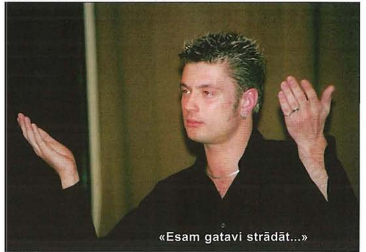
«Esam gatavi strādāt...»

Ļoti svarīgs uzdevums, ko vēlamies izpildīt šajā projektā, — motivēt nedzirdīgo jauno paaudzi mācīties, apgūt profesiju, pilnveidot savas prasmes. To esam iecerējuši veikt, organizējot radošās nometnes ar