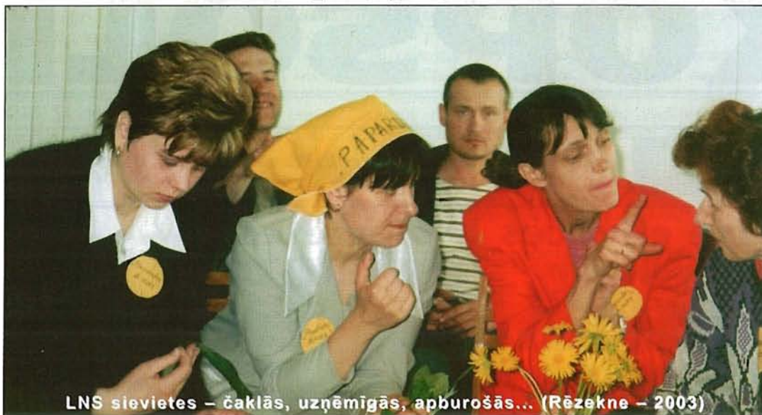
LNS sievietes – čaklās, uzņēmīgās, apburošās... (Rēzekne – 2003)