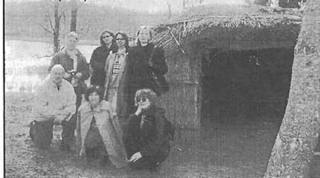
Āraišu ezerpils apmetnē.

Celojumu maršrutus veidoja «KS» redakcija, izmantojot dažādus ceļvežus un sakrātos izgriezumus no tūrisma lappusēm preses izdevumos. ♦