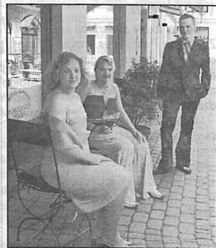
Dzintara Stepāna teksti un foto.