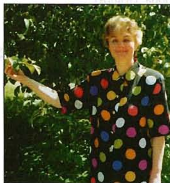
G. Paņko: «LNS ir vienīgais mūsu spēks un ierocis cīņā par sava liktens virzību.»

Tāpēc LNS jubilejā vēlu visiem gudrību, veselību un izturību jaunu uzdevumu izpildē.»