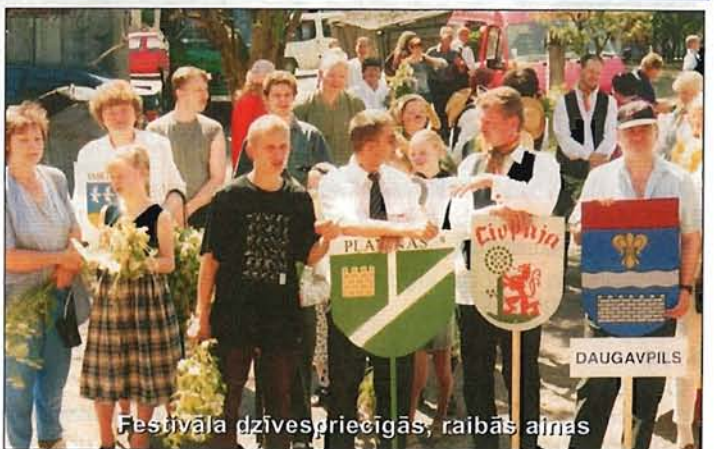
Festivāla dzīvespriecīgās, raibās ainas

- uz mēģinājumu «Rītausmā» sanāk estrādes deju kolektīvs - Daugavpils MRU saņem jaunu ražošanas kompleksu