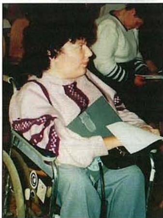
G.Anča: «Būt nedzirdīgam nenozīmē būt nesadzirdētam.»

LNS sadarbojas ar daudzām radnieciskām organizācijām, lai kopīgi veiktu risinātu visām svarīgus jautājumus. To vidū pirmām kārtām tās, kuras tieši saistītas ar invalīdu mērķauditoriju. Kopīgi projekti un pasākumi, kā arī atsevišķas aktivitātes tapušas ar Atbalsta fondu invalīdu uzņēmējdarbībai, jauniešu organizāciju «Efraims», invalīdu apvienībām «Sustento», «Apeirons», Nedzirdīgo bērnu vecāku asociāciju, Latvijas Invalīdu biedrību, fondu «Klusums» u.c.