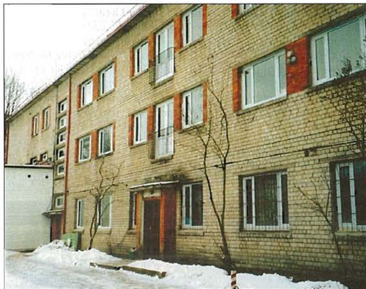
LNS Baltais nams atdzima no uzņēmuma vecās kopmītnes, 2000

Rīgas biedrība atrodas: Elvīras ielā 19, Rīga, LV 1083, tālr./tekst.t./fakss 7471561, e-pasts: rigasrb@lns.lv