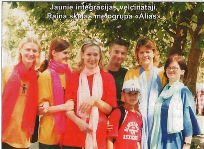
Jaunie integrācijas veicinātāji. Raiņa skolas melogrups «Alias»

- Baltijas nedzirdīgo Mākslas dienas Rīgā (VIII)