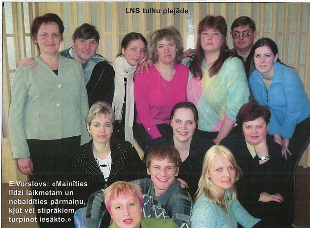
LNS tulku plejāde

Komunikācijas tehnoloģijas pēdējos gados attīstās ļoti strauji. Ja pirms četriem gadiem sa-