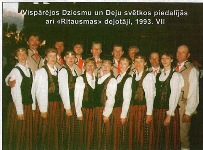
Vispārējos Dziesmu un Deju svētkos piedalījās arī «Rītausmas» dejotāji, 1993. VII

- nodibinās LNB mācību un ražošanas darbnīca (1.1), vēlāk pārdēvēta par kombinātu (MRK), uzņēmumu (MRU)