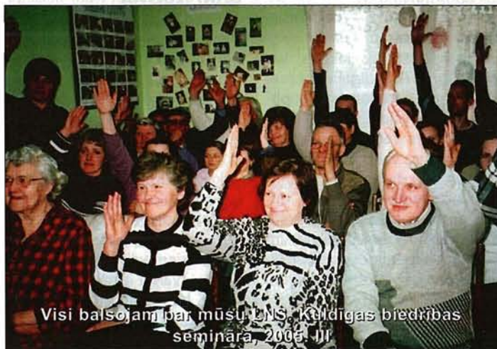
Visi balsojam par mūsu LNS, Kuldīgas biedrības semināra, 2005. III

Viens no galveniem secinājumiem — vietējām nedzirdīgo organizācijām ir visai vāja sadarbība ar sava reģiona sociālās palīdzības dienestiem. Par to liecināja daudzie jautājumi un