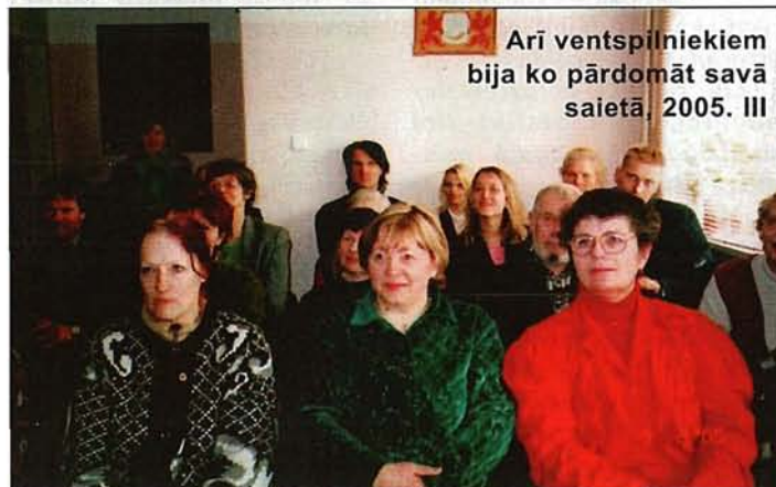
Arī ventspilniekiem bija ko pārdomāt savā saietā, 2005. III

LNS Foruma programma: daudz vērtīga un interesanta visiem!