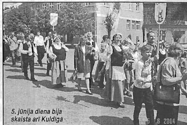
5. jūnija diena bija skaista arī Kuldīgā

1998. gadā visi devāmies uz Ventspili, kur LNS koncerts «Pie jūras dzīve mana» notika Brīvdabas estrādē.