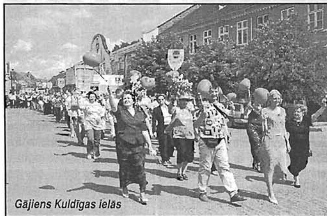
Gājiens Kuldīgas ielās

LNS vārdā pateicību saņēma visi kolektīvi, kas piedalījās festivālā. Īsumā par katru 2.lpp.!