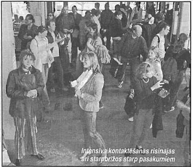
Intensīva kontaktēšanās risinājās arī starpbrīžos starp pasakumiem

— To var tulkot dažādi. Pirmkārt, jau to, ka izrādes tapa uz vietas. Otrkārt, nedzirdīgajiem vienmēr ir jācinās un jāpānāk, lai tiktu pieņemta arī viņu māksla. Kāpēc to atlikt uz vēlāku laiku? Nē, labāk tagad.