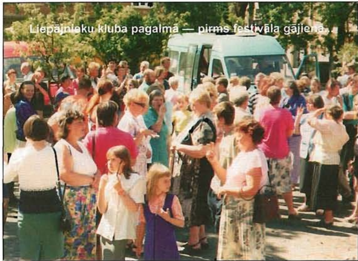
Liepājnieku kluba pagalmā — pirms festivāla gājiena.

Protams, mēs priecājamies par projektu. Varēsīm izbraukt Valmieru, «Alsviķus»,