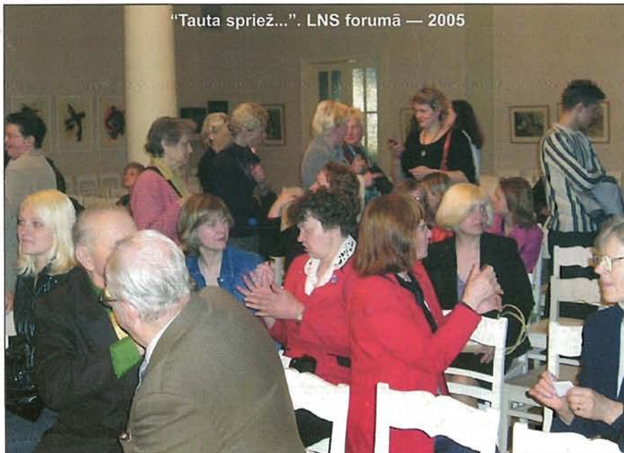
«Tauta spriež...». LNS forumā — 2005

Pielikumos – LNSF Statūtu projekts un tematiskās lapas «Tavas tiesības un iespējas strādāt».