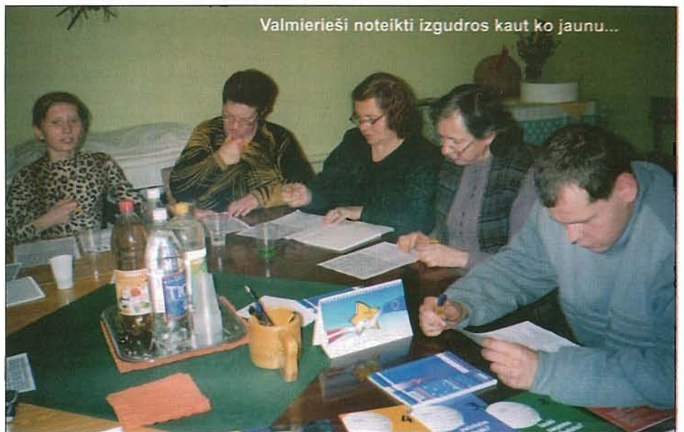
Valmierieši noteikti izgudros kaut ko jaunu...

Šis projekts ir svētīgs. Tagad varēsīm daudz vairāk uzzināt, jo būs iespēja izmantot 10 lektorus, apmeklēt muzejus, izstāžu zāles, doties ekskursijā. Organizēsīm tematiskos pasākumus, piemēram, mūsu biedrībā nekad nav notikusi jubilāru godināšana