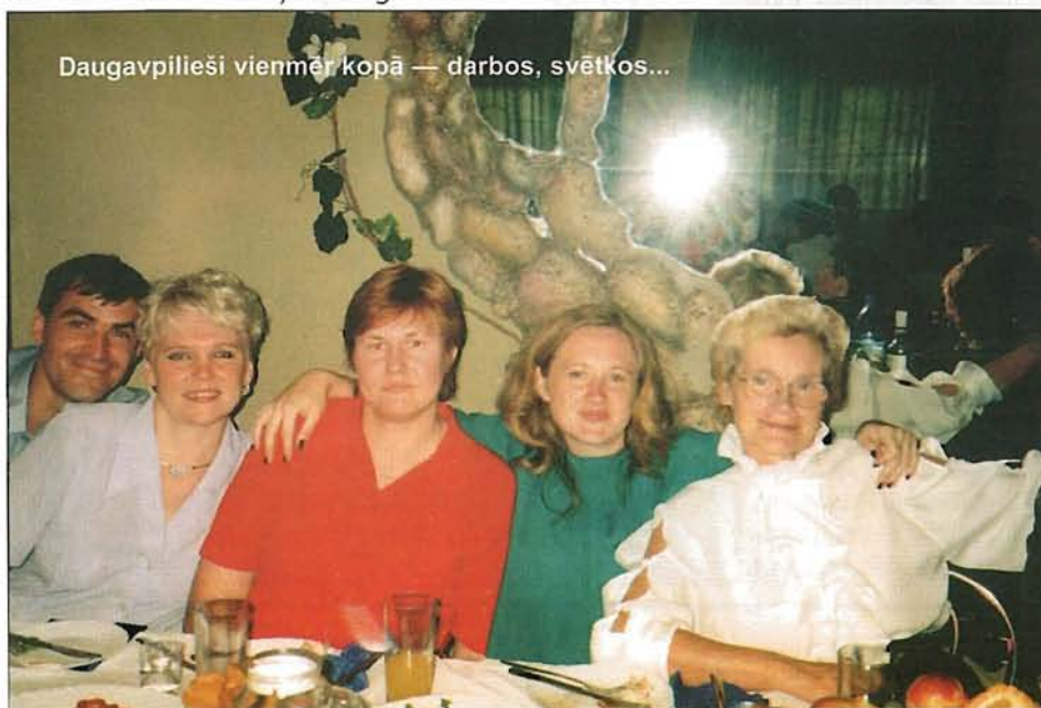
Daugavpīlieši vienmēr kopā — darbos, svētkos...

iepazīsimies ar jauniem draugiem, kļūsim gudrāki, lekcijas klausoties un presi kopā pārļausot. It sevišķi priecājamies par transporta un dienas naudas atmaksu. Mūsu jaudīm ar visai šauru rociņu tā ļoti būtiska pretimnākšana no Eiropas.