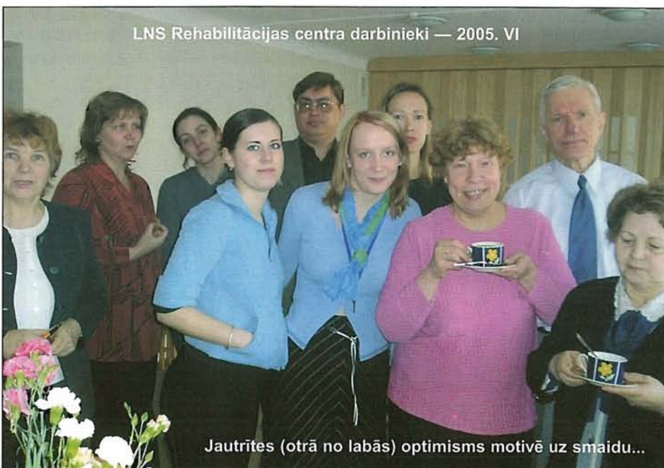
LNS Rehabilitācijas centra darbinieki — 2005. VI