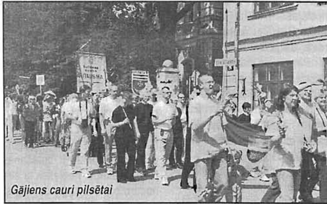
Gājiens cauri pilsētai

Par spīti lielajai pašdarbnieku saimei un prāvajam skatītāju pulkam, pašmāju saimnieki bija godam sagatavojušies. Viņi dāsni uzņēma visus pašdarbības dalībniekus no tu-