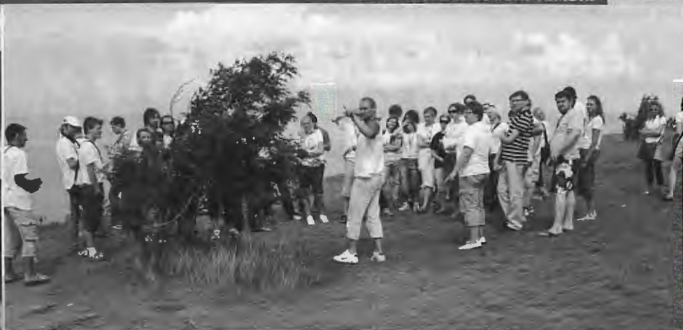
SĀREMĀ, PIE JŪRAS...