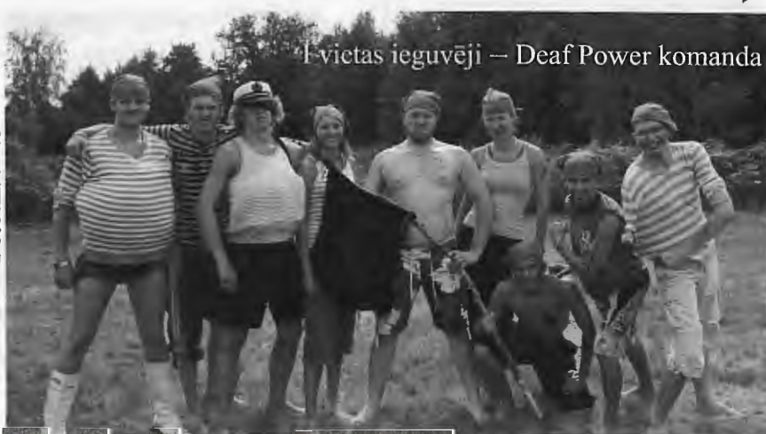
1. vietas ieguvēji – Deaf Power komanda