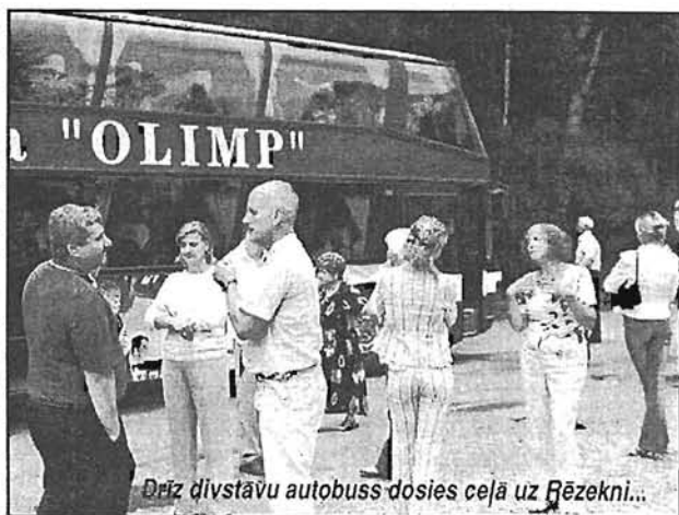
Drīz divstāvu autobuss dosies ceļā uz Rēzekni...

Sevišķi aizrautīgi un asprātīgi virknējās fotokadri LNS prezidenta pašrocīgi veidotajā veltījumā — novēlējumā visai LNS šajā nozīmīgajā laikā, kad teju nākamajā sāksies nozīmīgākais notikums LNS dzīvē — kongress ar LNS veikumu analīzi, vadības vēlēšanām un perspektīvas iezīmēšanu nākamam darbības cēlienam. Sevišķs akcents te bija likts uz labāko cilvēcisko īpašību un saskarsmes kultūras pilnveidošanu. Vesela virkne mūsu «mazo brāļu» — no dzīvnieku pasaules