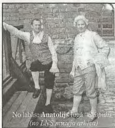
No labās: Anatolijs lugā „Skopulis”