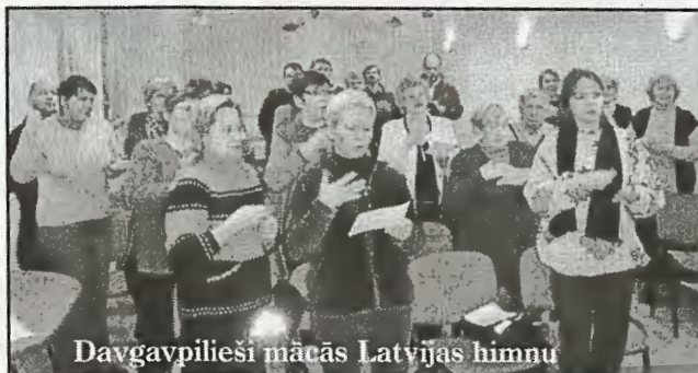
Daugavpīlieši mācās Latvijas himnu

Un kā ar pasākumiem? 19. janvārī jums bija interešu klubs "Es gribu būt Latvijas pilsonis"?