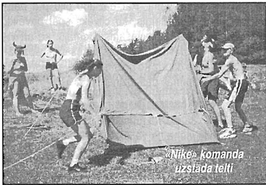
«Nike» komanda uzstāda telti

Dalībniekiem bija jāspēlē minifutbols, volejbols, bet spēlēs bija ieviesti jauninājumi. Piemēram, futbola spēlēja ar bērnu piepūšamo bumbu, bet volejbola tīkls bija blīvs un necaurredzams pretēji parastajam. Notika arī šautriņu mešana, telts uzcelšana un nojaukšana, virves vilkšana. Arī šeit bija