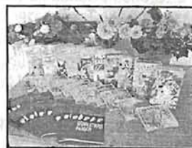
ZVC projektu «produkcija»