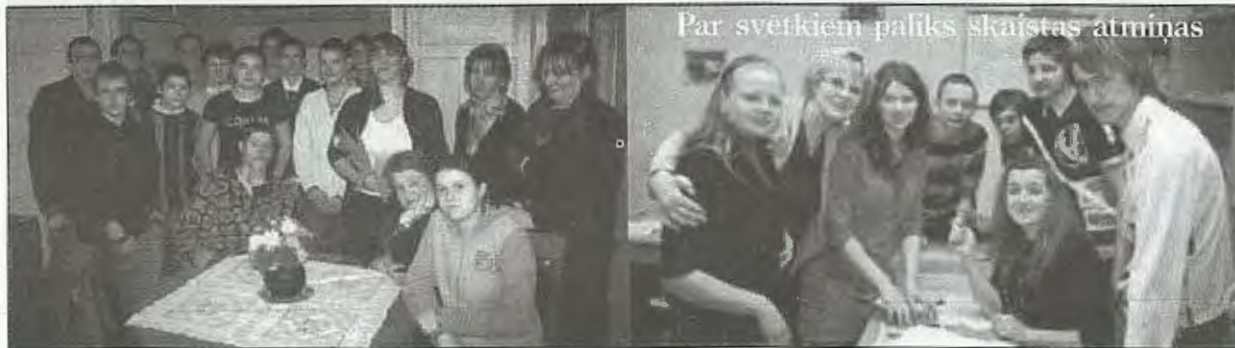
Par svētkiem paliks skaistas atmiņas

Paldies A.Čaka memoriālā dzīvokļa laipnajiem saimniekiem.