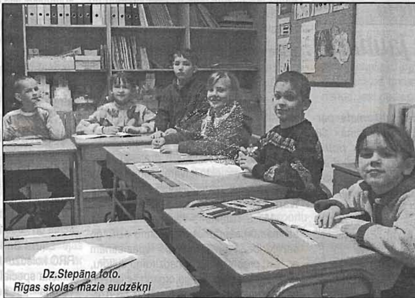
Rīgas skolas mazie audzēkņi

Nereti ir dzirdēts, ka nedzirdīgām bērnam skolā piemērotākā būtu viņam līdzīgo vide — nedzirdīgi skolas biedri, skolas darbinieki un pedagogi, tomēr paši nedzirdīgie jaunieši šo uzskatu diskusijā apstrīdēja. Viņuprāt, kopā ar dzirdīgiem vienaudžiem uzaudzis nedzirdīgs bērns vēlāk daudz veiksmīgāk integrēsies dzirdīgo sabiedrībā,