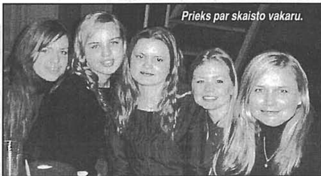
Prieks par skaisto vakaru.

Un tā jautrībā ātri aizvirpuļoja viss vakars. Pēc tam vēl sapņos man rādījās krāsaini tērpi, smaidošas sejas, smieklī. Paldies visiem, kas atnāca, kas palīdzēja un gādāja par to, lai visiem labi, jautri, neaizmirstami piedzīvojumi. ♦