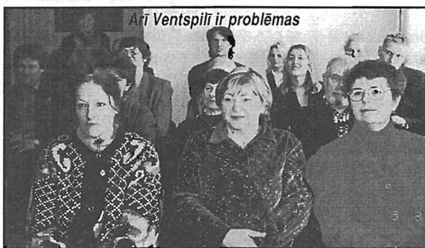
Arī Ventspilī ir problēmas

šodien, būtu atrisinātas jau agrāk, ikdienā kontaktējoties ar sociālās palīdzības organizatoriem katram savā dzīvesvietā (ar vai bez tulka). Seminārs bija svētīgs, parādot šo iespēju un iedrošinot cilvēkus pašiem drošāk doties pēc padoma un palīdzības savas pilsētas sociālajā dienestā.»