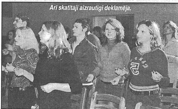
Ari skatītāji aizrautīgi deklamēja.