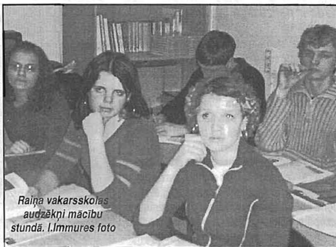
Raiņa vakarskolas audzēkņi mācību stundā.

Nedzirdīgie jaunieši zināja stāstīt ļoti daudzus gadījumus, kad viņus pašus vai viņu draugus pro-