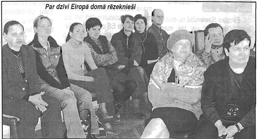
Par dzīvi Eiropā domā rēzeknieši

Disputa izskaņā raisījās visu kopīgā pamatdoma: ir pārejas laiks, cerēsim, ka mazbērni dzīvos labākos apstākļos, un mums jādara viss iespējams, lai šo laiku tuvinātu pēc iespējas ātrāk. Par to liecināja arī aptauja un intervijas disputa dalībnieku vidū, kā arī pārrunas pie kafijas galda ar jau tradicionālo lielo eirokliņģeri centrā. ♦