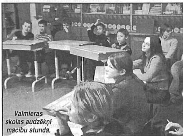
Valmieras skolas audzēkņi mācību stundā.

Pozitīvs piemērs tam, ka šādas barjeras ir iespējams veiksmīgi pārvarēt, ir Rīgas Pedagoģijas un izglītības vadības augstskola (RPIVA), kuru pagājušā gadā