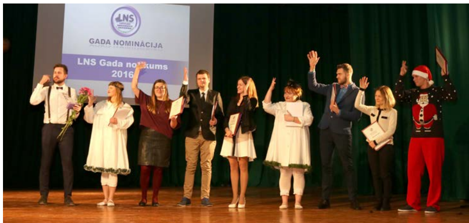
Par LNS Gada notikumu kļuva Baltijas Nedzirdīgo jauniešu festivāls Rītausmā. Tā autori ir LNS Jauniešu centra (JC) aktīvistu. Par to, ko katrs no viņiem darīja, lai taptu šis notikums, pastāstīja viņi paši.

Baltijas Nedzirdīgo jauniešu festivālam 2016 LNS JC gatavojās jau no augusta. Organizēja sapulces, apspriedās par dažādiem pienākumiem, jaunām idejām un problēmām, kuras uzradās darba procesā. Tuvojoties festivālam, tika konkrēti sadalīti pienākumi, un tie bija šādi.