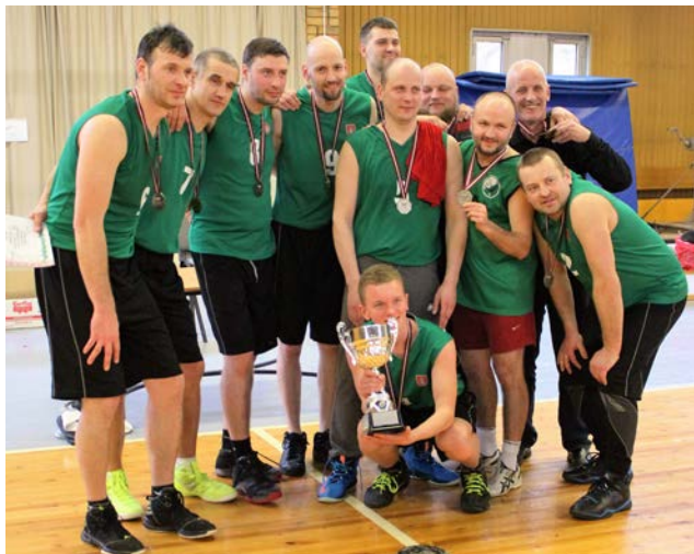
Latvijas Nedzirdīgo basketbola čempionāts vīriešiem risinājās 5. un 6. martā Ķekavas sporta centrā "Bultas".

Šogad piedalījās četras komandas: "Liepava – 1", "Liepava – 2", "Nedzirdīgo boulings", "Zaļā paparde"/VVBIVS – AC/RNBI (sporta kluba "Zaļā paparde", Valmieras vājdzirdīgo bērnu internatīvis-