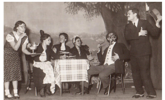
Izcēlās katrs sīkums bija nolikts savā vietā, un pēc vajadzības vienmēr viss aktieriem bija pie rokas.

teiksim paldies par viņas ieguldījumu nedzirdīgo kultūrā.” ▲