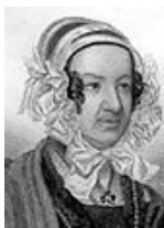
Šarlote Elizabete Tana (Charlotte Elizabeth Tonna)