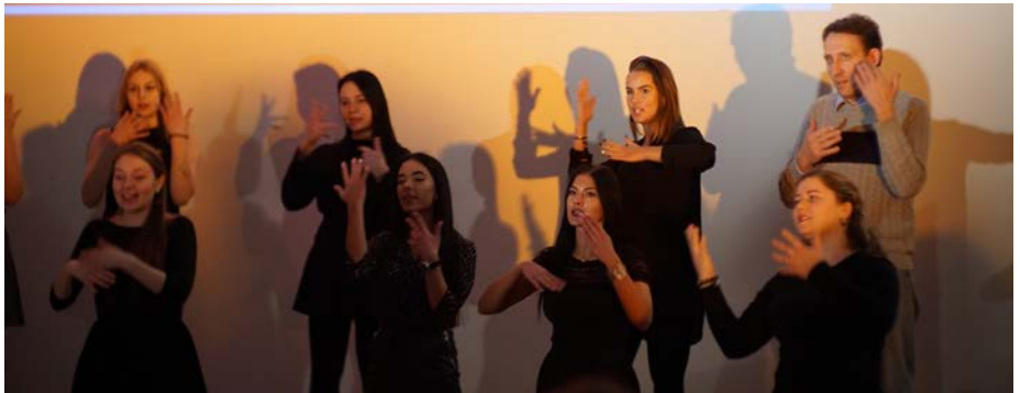
Pirmo reizi zīmju valodā melodeklamēja dzirdīgo klašu skolēni