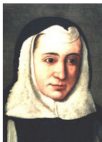
Terēza de Kartagena (Teresa de Cartagena)

Gaidas tolaik kļuva par vienu no pirmajām organizācijām, kas centās likvidēt nevienlīdzību rases vai izcelsmes un invaliditātes dēļ.