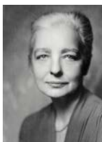
Rūta Benedikta (Ruth Benedict)

industriālā revolūcija piedzīvoja uzplaukumu. Viņa kļuva nedzirdīga 10 gadu vecumā un aizrautīgi rakstīja par sieviešu tiesībām un sociālajiem jautājumiem. Līdz šai dienai joprojām uzskatīta par vienu no ietekmīgākajām tālaika Anglijas rakstniecības pārstāvēm.