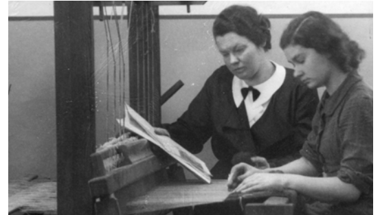
Rokdarbu nodarbībā Rīgas Kurlmēmo skolā no 1939. gada līdz 1942. gadam.