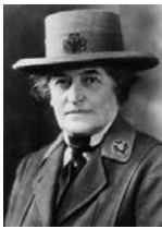
Džuljeta Gordona Lova (Juliette Gordon Low)

1912. gadā izveidoja Amerikāņu gaidu organizāciju, lai radītu jaunām sievietēm iekļaujošu vidi, kur varētu ap-