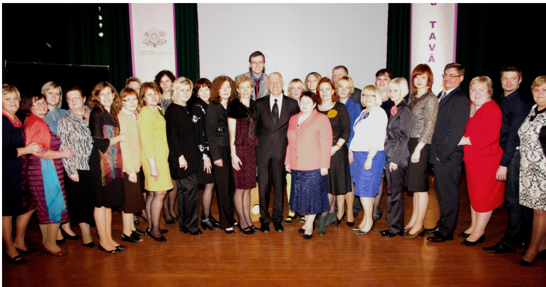
Projekta "Klusuma pasaule" radošā komanda noslēguma pasākumā (2013, Rītausmā)

Kā jau iepriekš minēju, katram ir savas vērtības, līdz ar to arī prasības un vajadzības. Sasniedzot noteiktu labklājības līmeni, mainās arī šīs vērtības un pieaug vajadzības. Mēs esam sabiedrības neliela daļa, kura nemitīgi attīstās, tiek izgudrotas arvien jaunas tehnoloģijas un pakalpojumi, kas padara mūsu dzīvi labāku. Protams, šajā attīstības ciklā ir gan kritumi, gan kāpumi. Šajā attīstības ciklā pieaug arī nedzirdīgo kopienas locekļu vajadzības, bet katrs mēs esam personība, un katram no mums šīs vajadzības ir dažādas, tāpat kā katra zināšanas, spējas un aktivitāte, sniedzot savu ieguldījumu LNS attīstībā.