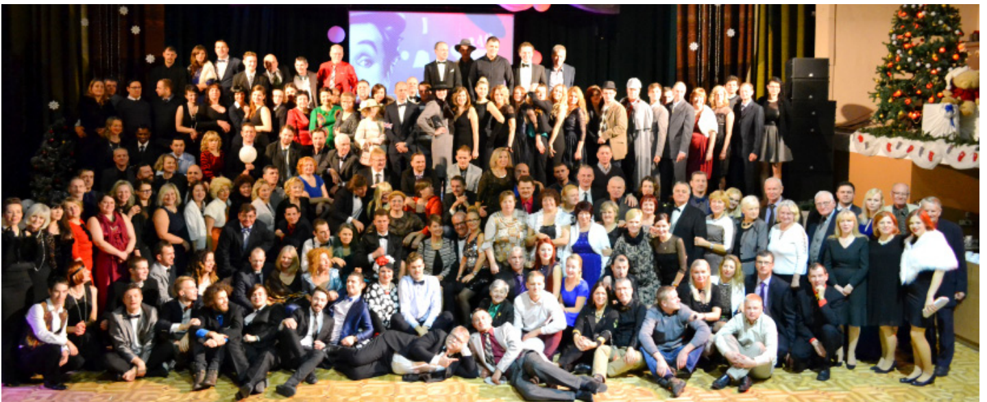
Gadumijas slavenību balle Rītausmā (2014/2015)