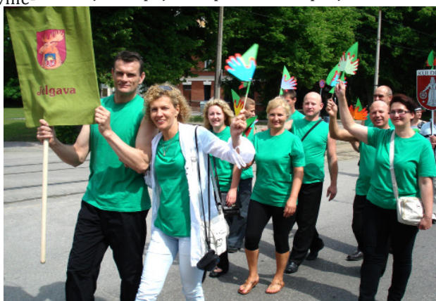
Jelgavnieki – pirmo reizi festivālā