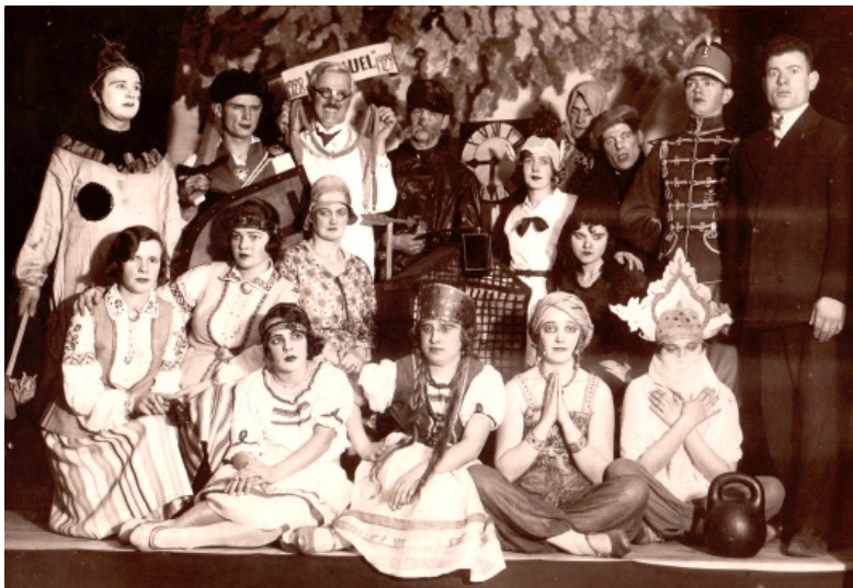
Maskuballe Vecgadā Rīgas biedrībā „Immanuel” (1928 – 1929)

1945. gada 18. maijā tika izveidota Latvijas (vēlāk Latvijas PSR) Kurlmēmo biedrība. Interesanti, ka padomju laikos vārdu „kurlmēmo” ik pa laikam nomainīja uz „nedzirdīgo” un atpakaļ. Pirmajos pēckara gados visi Latvijā dzīvojošie nedzirdīgie biedri bija Latvijas Nedzirdīgo biedrības (LNB) Centrālās valdes uzskaitē. Kad biedru skaits jau pārsniedza 600, LNB sāka veidot nodaļas vairākās Latvijas pilsētās.