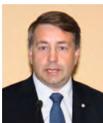
Uldis Augulis, labklājības ministrs

D a u d z o s Latvijas prezidentūras pasākumos akcentēta tieši invaliditātes politika, kas paredz nepieciešamību pilnveidot un attīstīt cilvēku ar invaliditāti iespējas, sekmēt viņu vienlīdzīgas iespējas.