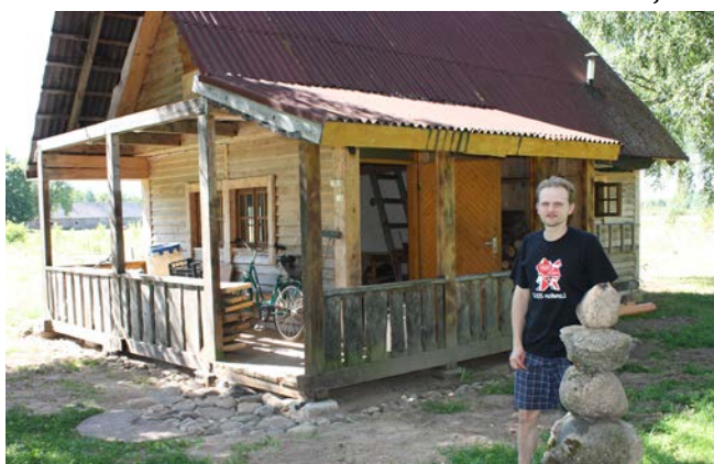
Pašu rokām celtā pirtīņa