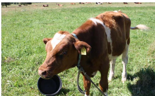
Baložkalnu ganāmpulka pārstāvis – bullītis