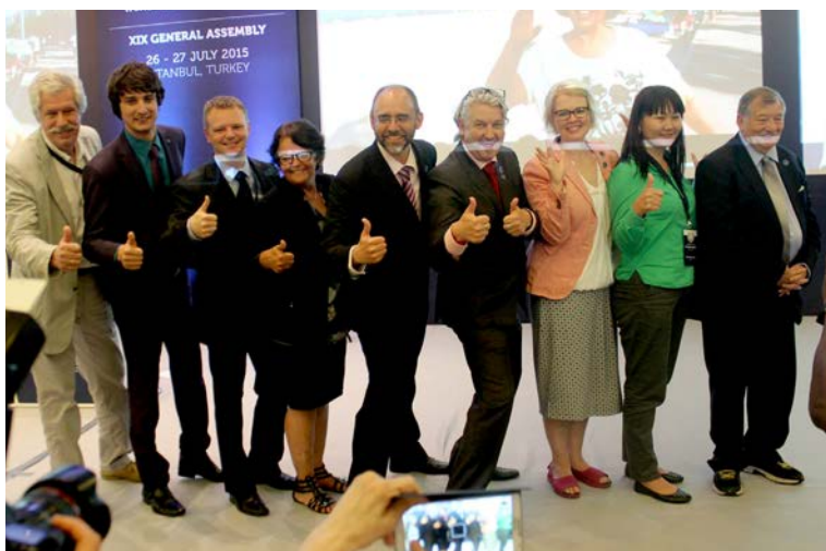
WFD jaunievēlēta valde

Par Franciju tika nodotas 38 balsis, par Honkongu 35 balsis, un tā 2019. gadā WFD GA un kongress norisināsies Francijas galvaspilsētā Parīzē .