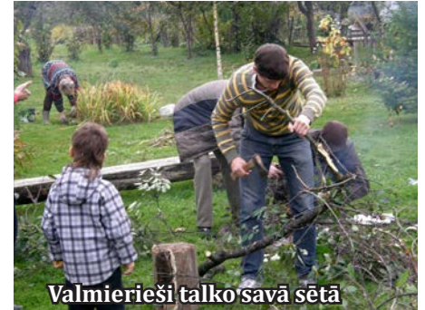
Valmierieši talko savā sētā

Šī tradīcija aizsākās pirms septiņiem gadiem ar talku 2008. gada 13. septembrī, kas bija kā iedzīvotāju dāvana Latvijai tās 90. dzimšanas dienā. Šajos gados vides sakopšanas pasākumos kopumā ir piedalījušies ap 795 000 entuziastu.