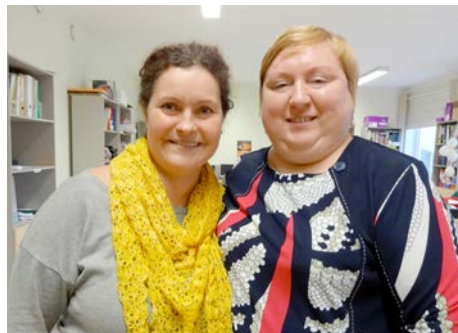
Divas viceprezidentes: Igaunija – Latvija

Pēc tam viesojāmie Igaunijas Nedzirdīgo biedrībā, kur mūs uzņēma biedrības projektu vadītāja, kas iepazīstina ar savas organizācijas vēsturi, aktu zāli, videoziņu sagatavošanas procesu un darba telpu. Nekā īpaša vai nezināma – video sagatavo līdzīgi kā pie mums.