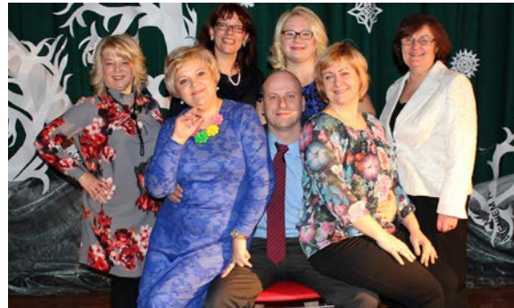
Sociālās rehabilitācijas nodaļas darbinieki

tībā, par veiksmīgu sadarbību ar pašvaldībām un finanšu resursu piesaisti, par ieguldījumu zīmju valodas un amatiermākslas izkopšanā – atsevišķi katrs