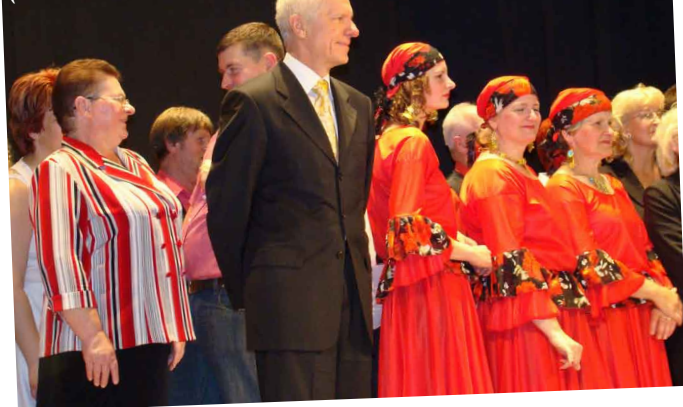
Pašdarbības festivālā Ventspilī

Mīlestību es jums visiem novēlu, ģimenes siltumu un mīlestību. Viss pārējais ir pārejošs.▲