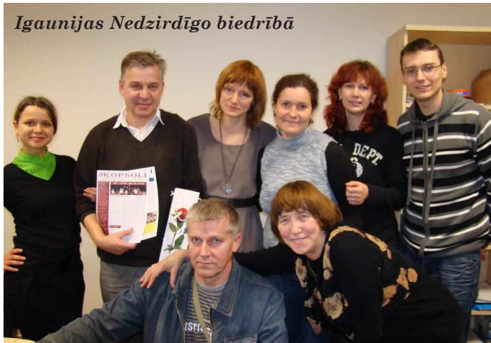
Igaunijas Nedzirdīgo biedrībā