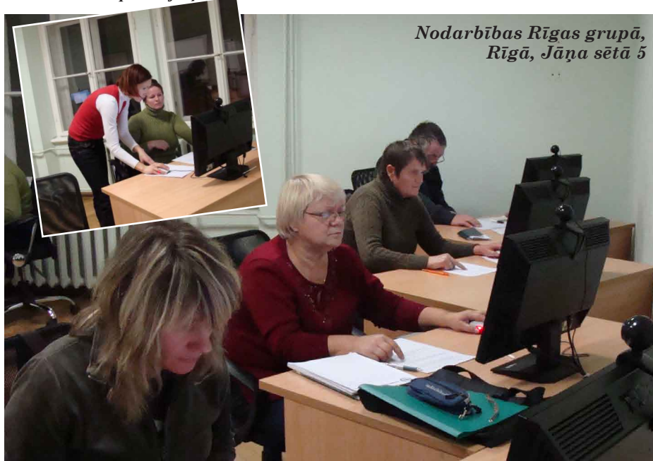
Nodarbības Rīgas grupā, Rīgā, Jāņa sētā 5

lai dalībniekiem visefektīvāk veidotu nepieciešamās prasmes. Iepazīstoties tuvāk ar mūsu aktivitātes dalībniekiem, rodas secinājums: daudzi nedzirdīgie tieši šajosursos pirmoreiz iemācījās patstāvīgi ieslēgt datoru, uzrakstīt nelielu tekstu Wordā , izveidot savu e-pasta adresi. Pirmoreiz arī redzēja, kā lietot i-bankas piedāvājumus u.c. Tāpēc uzskatu, ka esošā programma (42 stundas) dod pietiekamu iespēju apgūt pamatus.