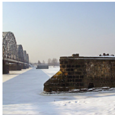
Zemgales tilta balsti, 2005. g.

Tolaik mēs sazinājāmies bez zīmju valodas, mums bija jārunā un jāprot lasīt no lūpām. Skolā zīmju valoda netika mācīta, un mēs, nedzirdīgie bērni, izdomājām paši savu zīmju valodu un tādā veidā savā starpā sazinājāmies.