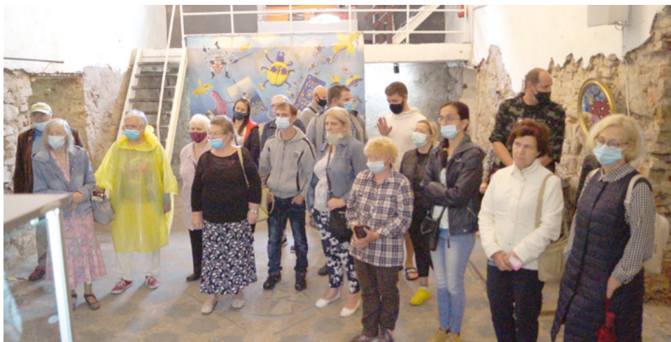
Valmierieši Pūres šokolādes muzejā iepazīstas ar šokolādes pirmsākumiem

Svētā Borisa un Gļeba pareizticīgo katedrāli, jo bija jau pievakare un pārējās durvis bija slēgtas.