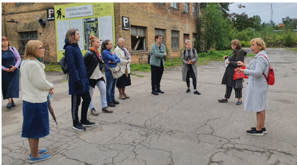
Rīdzinieki apskata izstādi "Mobilais muzejs. Nākamā sezona."