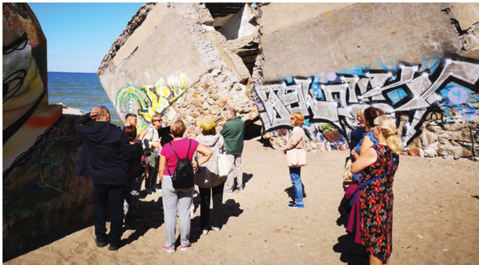
Liepājnieki Ziemeļu fortos

Redāns ir 19. gadsimta beigās celtā Liepājas jūras cietokšņa daļa, kur notiku-