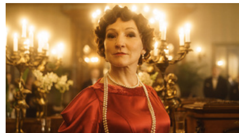
Emīlija. Latvijas preses karaliene