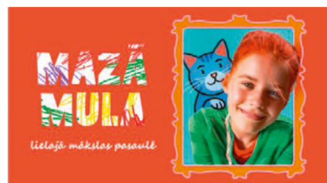
Mazā Mula lielajā mākslas pasaulē