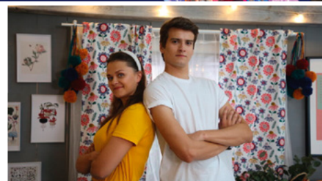
Emī un Rū