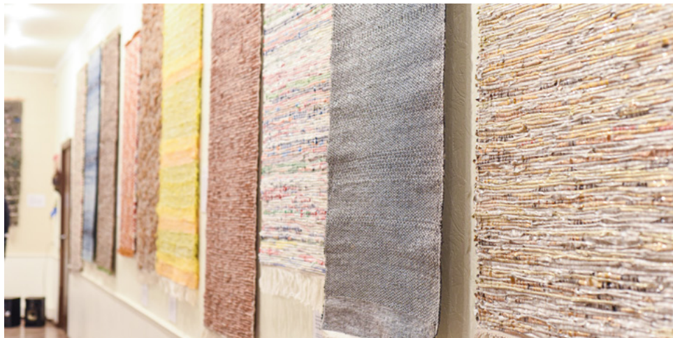
Turpinājums no 1. lpp.