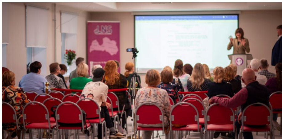
Projekta 2. aktivitātes "Kampaņa organizācijas atpazīstamības un pozitīva publiskā tēla veicināšanai pilsoniskās sabiedrības attīstībai" diskusija