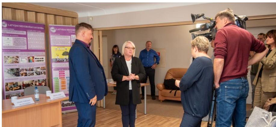
Preses konference par LNS projektu "Demokrātijas kultūras laboratorija"