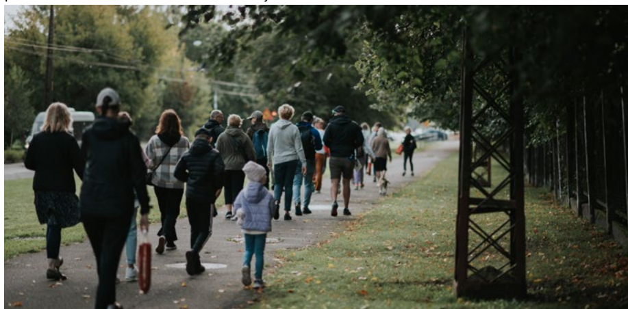
Labdarības pārgājiens "Ejam visi!"