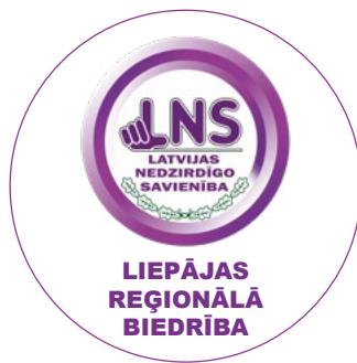
Gada reģionālā biedrība LNS LIEPĀJAS RB