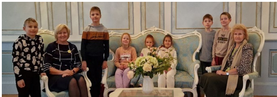
Rīgas Ēbelmuižas pamatskolas audzēkņi Melngalvju namā