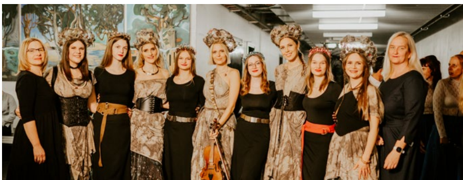
Etnogrupa "Tautumeitas" un Valmieras Gaujas krasta vidusskolas melodeklamācijas pulciņa meitenes