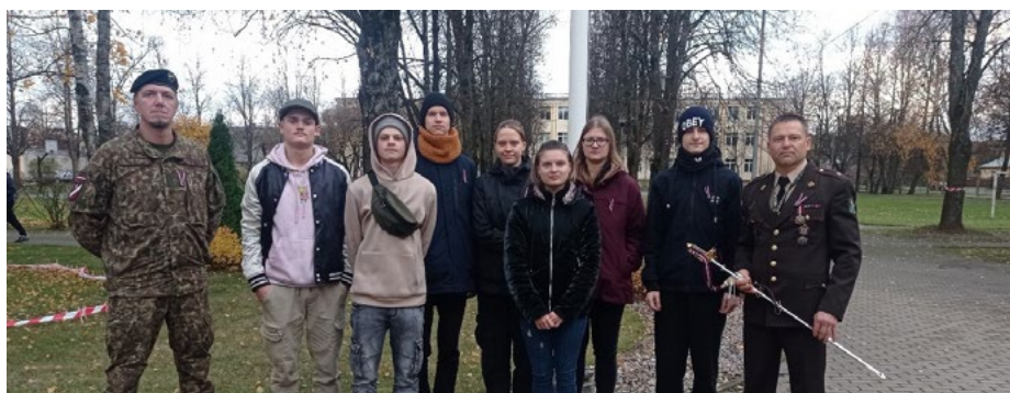
Rīgas Ēbelmuižas pamatskolā viesojas Nacionālo bruņoto spēku pārstāvji