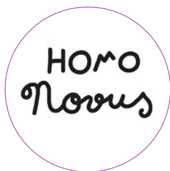
Gada pieejamība kultūrā nedzirdīgajiem "HOMO NOVUS"