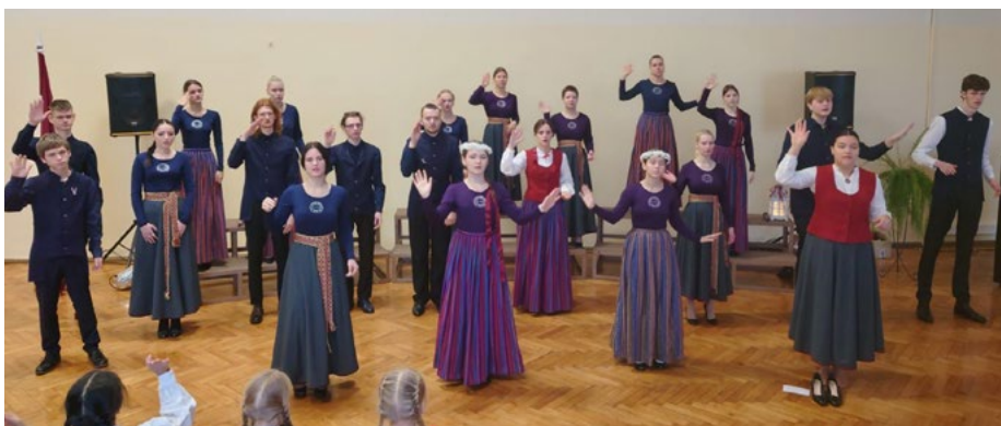
Rīgas Raiņa vidusskolas koncerts par godu Latvijas dzimšanas dienai "Saviju es Latviju"

• 9. decembrī Rēzeknē, Latgales vēstniecībā "Gors", notika fonda "Nāc līdzās" labdarības koncerts "Nāc līdzās Ziemassvētkos" Labdarības koncertā jau tradicionāli uzstājās arī skolas audzēkņi. Koncertu atklāja etnogrupa "Tautumeitas" un skolas melodeklamācijas pulciņa meitenes, kopīgi izpildot dziesmas "Guli, guli" un "Spodrē manu augumiņu".