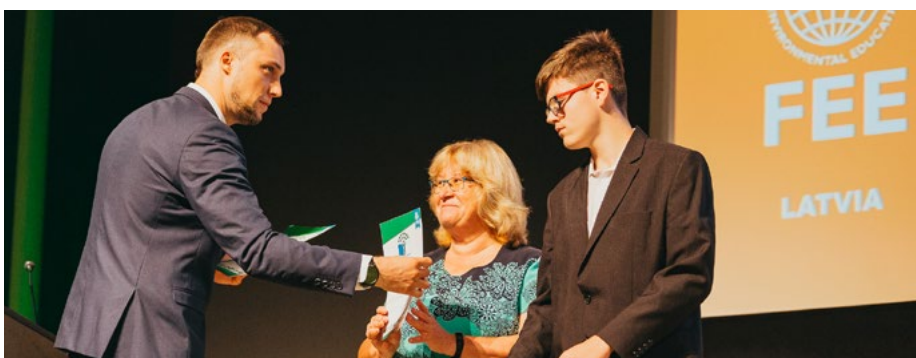
Valmieras Gaujas krasta vidusskola Ekoskolu programmā saņem zaļo karogu