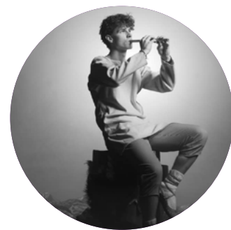
Gada amatiermākslas kolektīvs IZRĀDES "SPRĪDĪTIS" KOLEKTĪVS